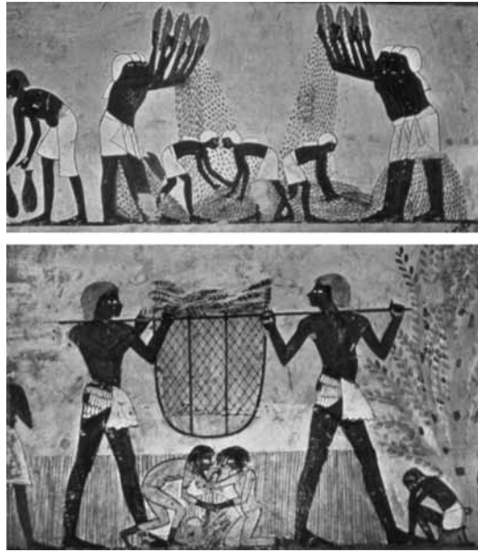
(Túmulo de Menna, século XIV a.C.)