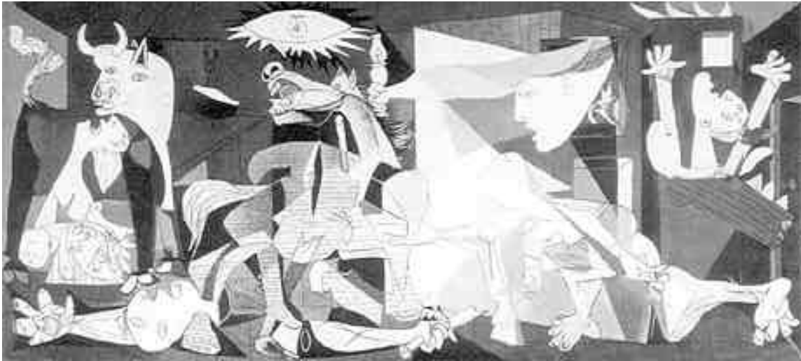
(Pablo Picasso, 1937.)

07. A pintura abaixo, de autoria do artista Pablo Picasso, é a representação subjetiva de um acontecimento histórico específico.